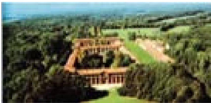
Parco La Mandria